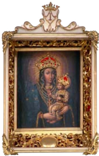
Cudowny Obraz Matki Bożej Pocieszenia

Zespół synagogałny tworzy wielka synagoga, mała synagoga i dom kahalny, w których obecnie mieści się Muzeum Pojezierza Łęczyńsko-Włodawskiego.