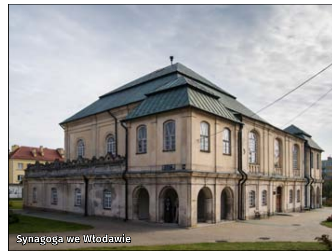
Synagoga we Włodawie

Synagoga jest jednym z najcenniejszych zabytków żydowskiej architektury w Polsce. Zbudowana w stylu barokowym w latach 1764–1774 składa się z wielkiej sali z szafą ołtarzową i eksponatami związanymi z kulturą żydowską.