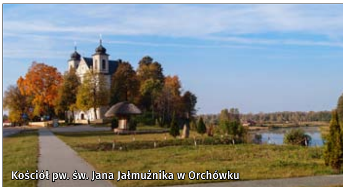
Kościół pw. św. Jana Jałmużnika w Orchówku