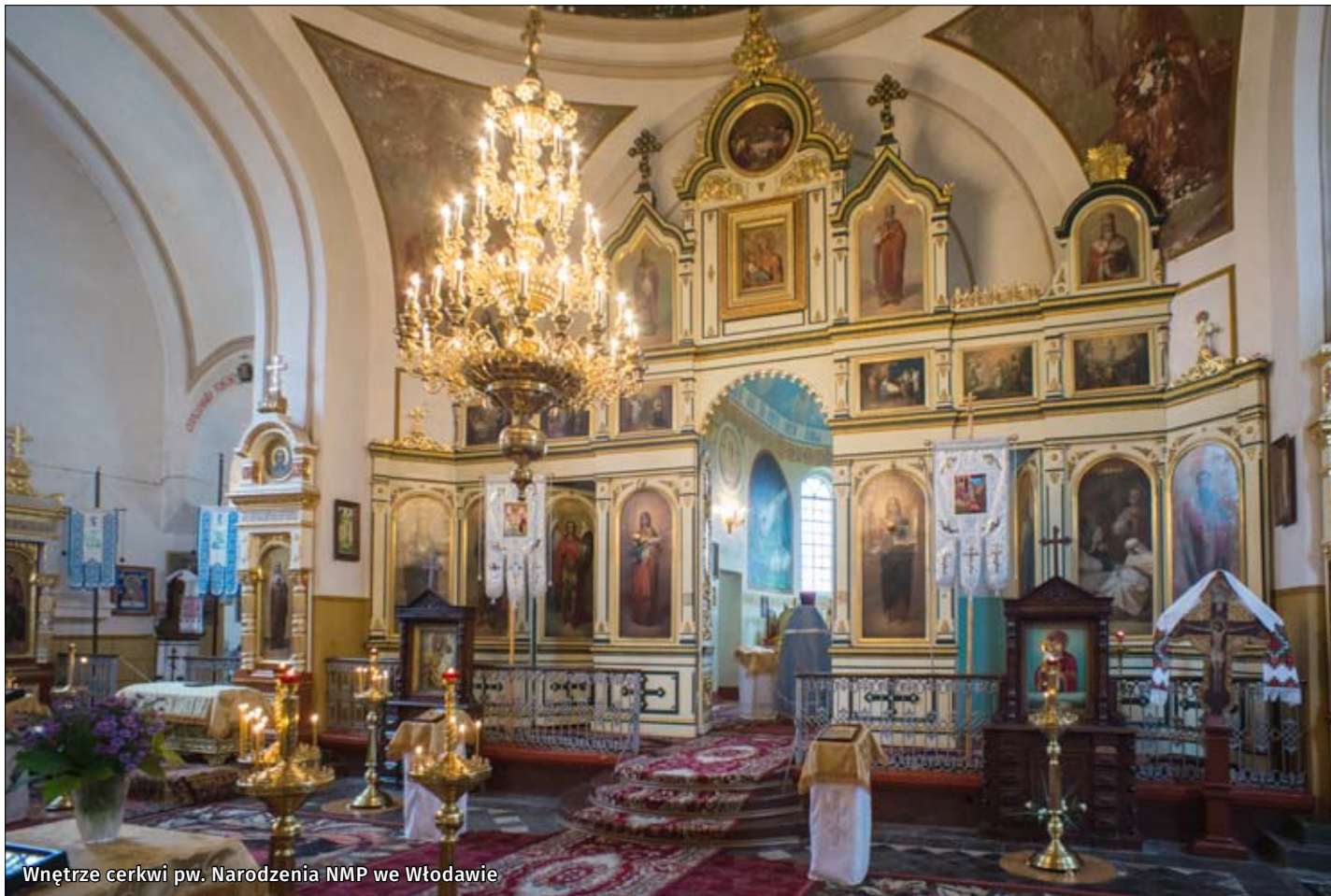
Wnętrze cerkwi pw. Narodzenia NMP we Włodawie

– resztki wspaniałej kultury i cmentarze, ostatnie ślady wielokulturowej przeszłości regionu.